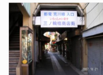
20. 三ノ輪橋駅入り口

三ノ輪橋駅は日光街道から50mほど入ったところにあり、その間は商店街になっている。本当にここが東京なの?とってしまう光景である。