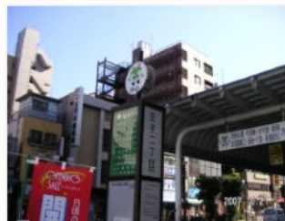
7. バス停王子二丁目