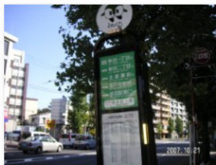
6. バス停王子四丁目