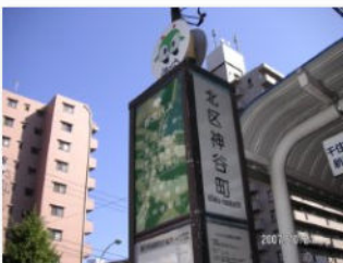
5. バス停北区神谷町