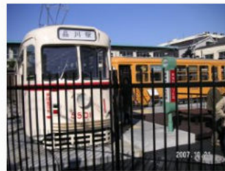
14. 荒川車庫の古い都電