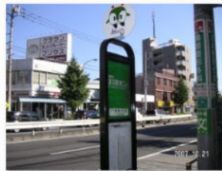
3. バス停志茂一丁目