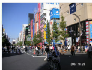
3. 秋葉原歩行者天国