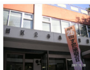
19. 寺島の名が図書館に