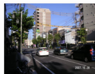
16. 東向島一丁目交差点