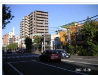
17. 東向島二丁目交差点