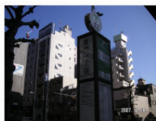
11. バス停雷門一丁目