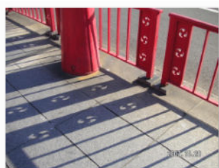
14. 吾妻橋レリーフの影