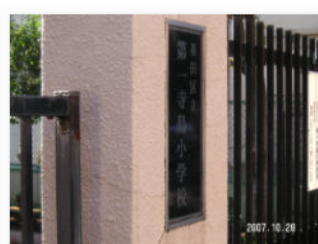
18. 寺島の名が小学校に