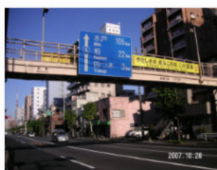
15. 水戸街道向島付近