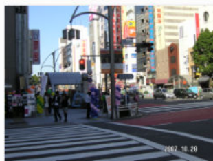
6. 上野広小路交差点