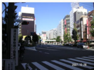
5. 上野三丁目交差点