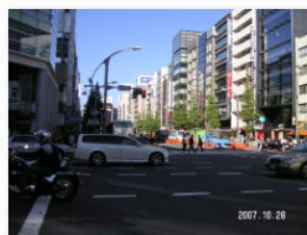
4. 外神田五丁目交差点