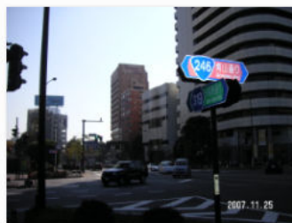
7. 青山一丁目交差点