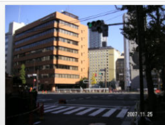
16. 浜松町一丁目交差点