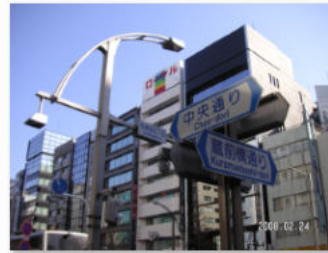
15. 外神田五丁目交差点