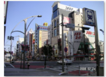
16. 上野広小路交差点

20番系統の時間違って不忍池の西側を歩いてしまったが、東側、不忍池と上野公園の間を北へ。モノレール(写真19)も池之端3丁目水月ホテル鷗外荘(写真20)も確認した。