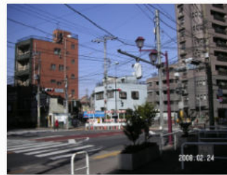
23. 千駄木二丁目交差点